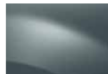
MODRÁ ELECTRIQUE RNZ (TE)