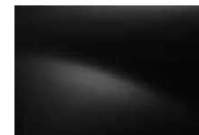
ČIERNÁ NACRÉ 676 (TE)