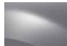
SIVÁ PLATINE D69 (TE)