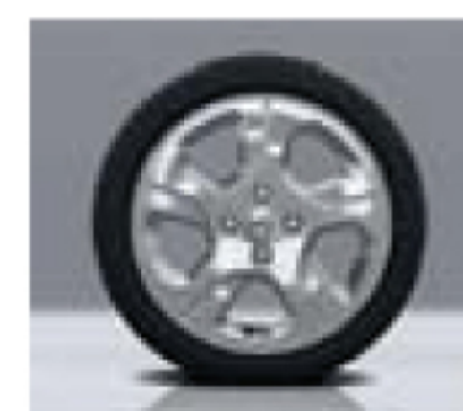
JANTE ALLIAGE 15" EMPREINTE